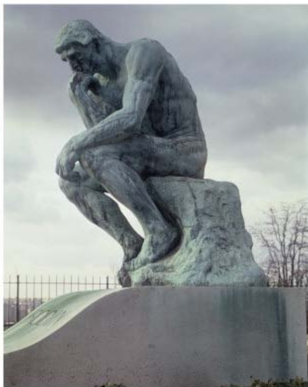
Bức tượng Le Penseur của A. Rodin

Và người ta cũng kể lại rằng trong những lần viếng thăm đó, Ngài ưa tới sân trong của trường để chiêm ngưỡng kiến trúc và hai cây dâu (murier) cổ thụ đã sống từ mấy trăm năm, từ khi các giáo sĩ thuở xưa mang về từ Á Châu về trồng tại nơi này, vốn là đất của họ đạo Vùng Thánh Giác Minh. Cho tới ngày nay, hai cây dâu này vẫn còn xanh tươi và được đặc biệt săn sóc trong khuôn viên trung tâm Cao Đẳng Mỹ Thuật Paris. » 27