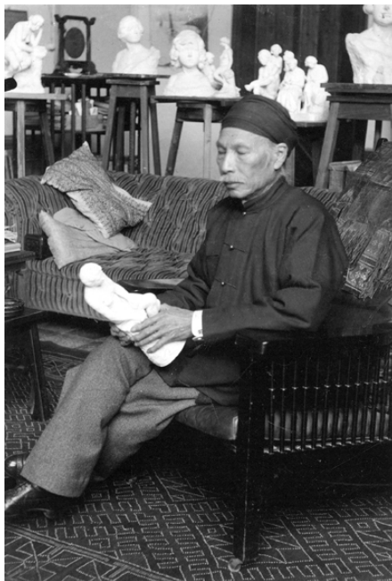
Vua Hàm Nghi năm 64 tuổi với những tác phẩm điêu khắc.