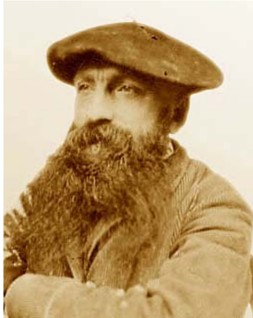
Điêu khắc gia Auguste Rodin