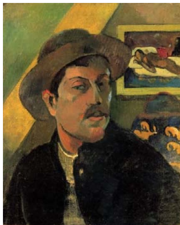
Paul Gauguin: tự họa

Paul Gauguin (1848-1903) được xem như là một trong những người sáng lập của ngành hội họa của thế kỷ thứ 20. Ông chịu ảnh hưởng của phái ấn tượng nhưng về sau thì lại vẽ theo kỹ thuật riêng của mình, dùng nhiều màu sắc và đường nét trái rộng để có thể diễn tả được những xúc cảm nội tâm của chính người nghệ sĩ. Nhờ những kinh nghiệm thu đạt được trong thời gian sống ở đảo Tahiti, ông đã tạo ra được một trường phái gọi là « nghệ thuật nguyên thủy » (primitive arts) và về sau hai nhà đại họa sĩ khác cũng đi theo chiều hướng của ông, đó là Matisse và Picasso. Bức tranh do ông sáng tác tại Tahiti vào thời này mang tên là « Chúng ta từ đâu đến, chúng ta là ai và chúng ta sẽ đi về đâu? » là một đại tác phẩm vô giá hiện nay trên thế giới dù rằng khi còn sống thì Gauguin là một họa sĩ rất nghèo.