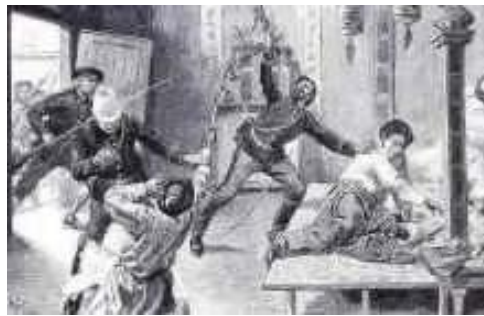
Vua Hàm Nghi bị quân Pháp bắt tại Quảng Bình Tranh vẽ

“Hàm Nghi, vị vua mới có 16 tuổi, đã ứng xử đầy tư cách, từ chối không nói chuyện, ngay cả nói đến tên của mình, với những người Pháp bắt ông ta. Nhà vua cũng không thèm gặp cả thân nhân vì họ đã trở về với triều đình Huế và sống những ngày còn lại của đời ông trong sự lưu đày tại Algérie, thuộc địa của Pháp tại Phi Châu.” 6