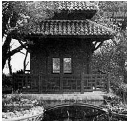
Ngôi đền trong Villa Gia Long.

Nhiều người tại Alger cho biết rằng sau khi Ông Hoàng Annam dọn về ngôi biệt thự mới đặt tên là Villa Gia Long, ông đã trang trí ngôi biệt thự này theo kiến trúc Á Đông. Đặc biệt trong vườn, ông có dựng một cái đền nhỏ, người Pháp gọi là « le temple », không phải là chùa (pagode), để làm nơi ông đến hướng lòng về quê hương tổ quốc và ông bà tổ tiên.