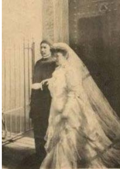
Hàm Nghi và Marcelle Laloë sau lễ thành hôn

Trong ngày lễ cưới, cô dâu Laloë mặc áo cưới màu trắng cổ truyền của Tây phương, còn chú rể thì đầu đội khăn đóng, mặc áo dài đen, đó là y phục cổ truyền của quê hương mà ông đã bị cưỡng bách rời bỏ cách đó mười lăm năm.