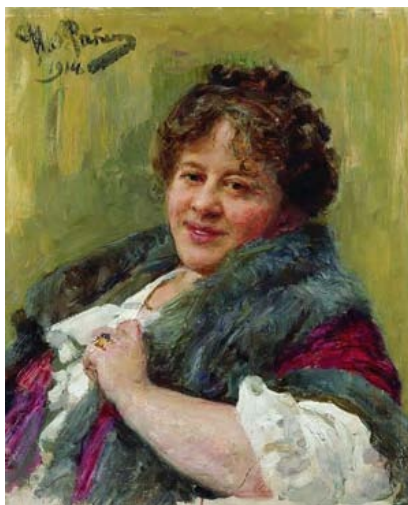
Nhà thơ, nhà văn T.L. Sepkina-Kupernhic (1874-1952) (Tranh vẽ của Repin)