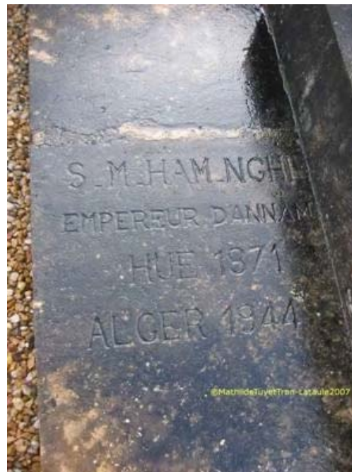
Bia mộ Vua Hàm Nghi tại làng Thonac 17