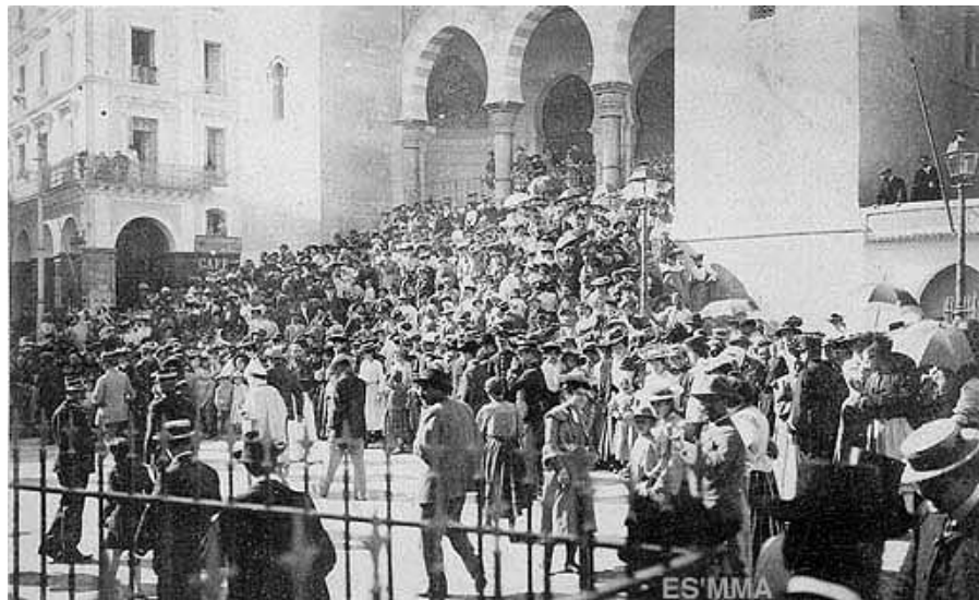
Dân chúng Alger chờ xem mặt cô dâu chú rể đối diện nhà thờ Alger

Đây có thể được xem như là một sự kiện lịch sử đối với cả người Pháp và người dân Algériens tại thủ đô Alger hồi đó cho nên dù không được mời vào dự lễ bên trong thánh đường, họ cũng đã kéo đến trước sân ngôi nhà đối diện nhà thờ để chờ được chiêm ngưỡng tân lang và tân giai nhân khi họ bước ra khỏi thánh đường. Dưới đây là hình ảnh đám đông đó được chụp lại và về sau được phổ biến như là những tấm cartes postales.