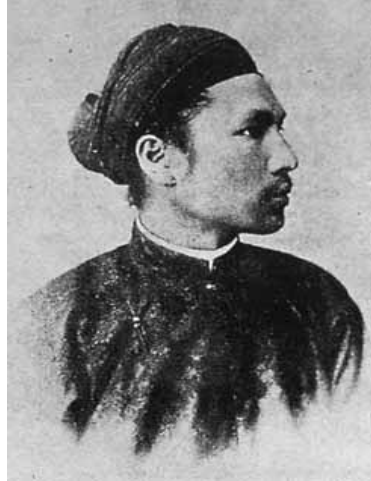
Vua Hàm Nghi trong quốc phục cổ truyền tại Alger.