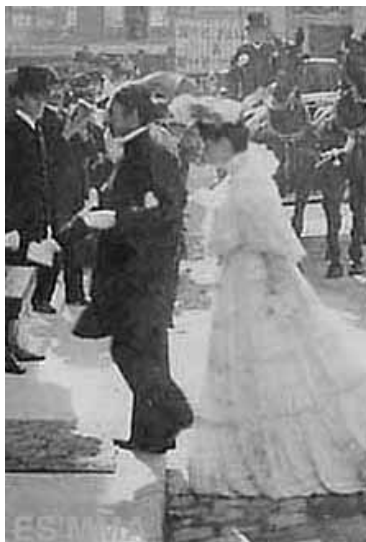
Hàm Nghi đưa cô Marcelle Laloë đi nhà thờ

Vua Hàm Nghi và bà Marcelle Laloë sống trong hạnh phúc cho đến ngày nhà vua từ giả cõi đời tại Alger vào năm 1944, hưởng thọ 73 tuổi và bà Laloë về sau trở về sống với con gái là Công chúa Nhữ Mây tại lâu đài Losse ở miền Nam nước Pháp vốn là quê hương của bà và từ trần vào ngày 5 tháng 9 năm 1974, thọ 90 tuổi.